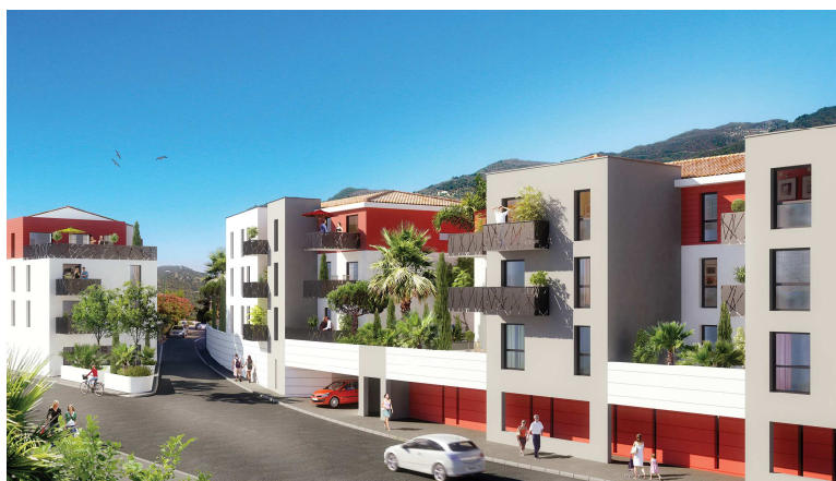
Roméo & Juliette

Egalement conçu par le cabinet d'architecture Rolin-Simonet-Vuillaume de St-Laurent-du-Var, le programme "Roméo & Juliette" bénéficie des normes thpe. Par ailleurs, la production d'eau chaude sanitaire est assurée par des capteurs solaires.