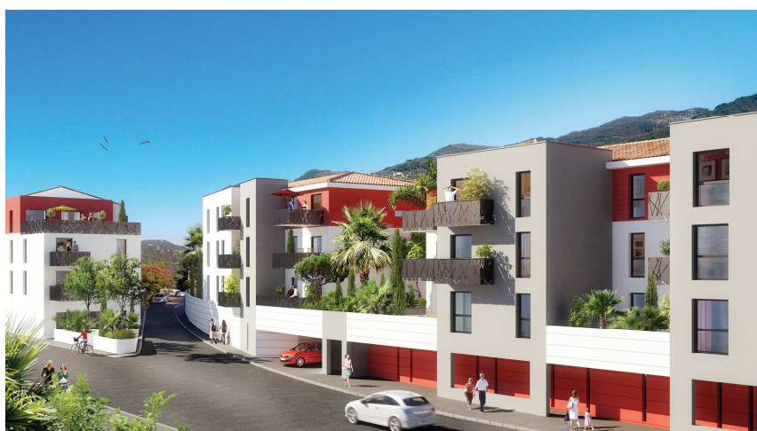
Roméo & Juliette